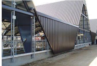
Ny kostald på Vejlskovgaard.

Den Europæiske Union ved Den Europæiske Fond for Udvikling af Landdistrikter og Ministeriet for Fødevarer, Landbrug og Fiskeri har deltaget i finansieringen af projektet.